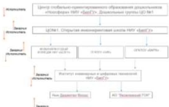
Рис.№2 Пример распределения ролей в Межорганизационном Потоке создания ценности по направлению «Инжиниринг» в НИУ «БелГУ»